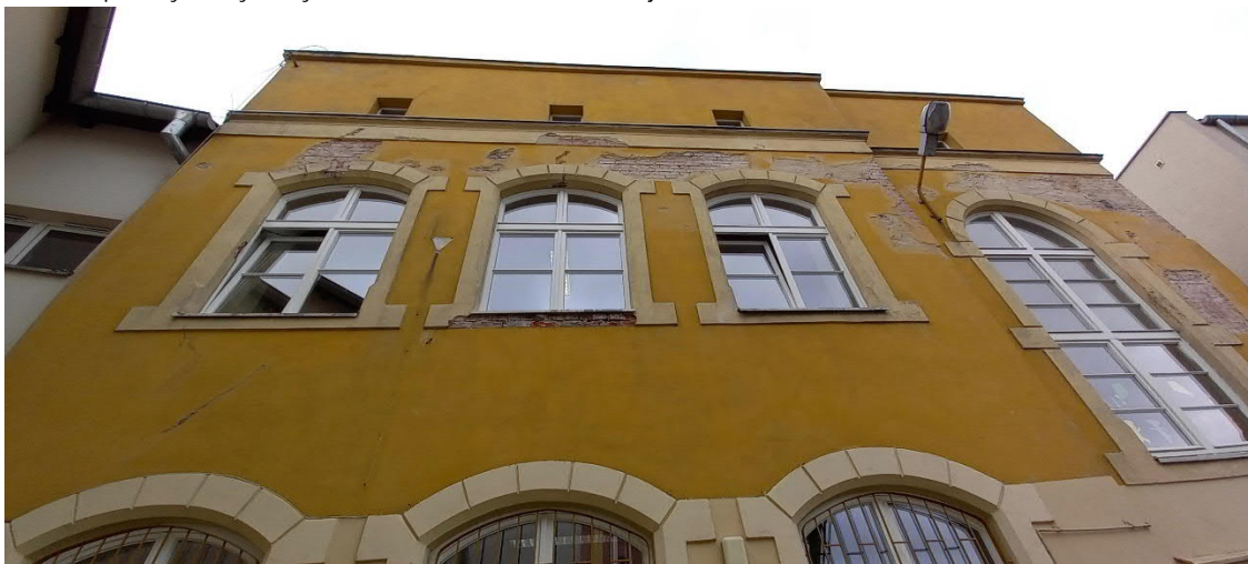
Widoczne ubytki tynku na elewacji, gzymsach i opaskach okiennych.