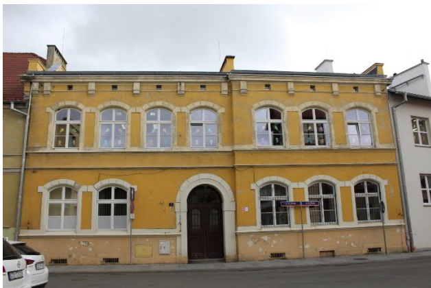
Uszkodzona elewacja budynku, drzwi wejściowe do renowacji.