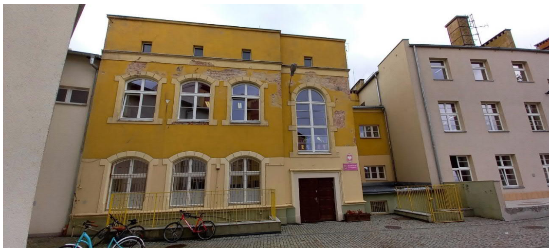
Elewacja wschodnia budynku nr 7.