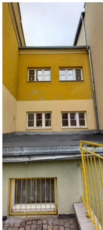
Widoczne ubytki w tynku na elewacjach, drzwi wejściowe oraz balustrady do renowacji.