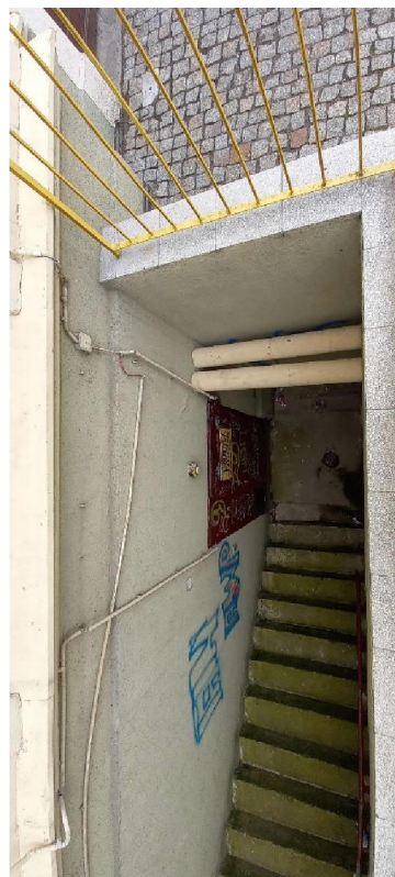
Drzwi do piwnicy do wymiany, balustrada i murek do renowacji.